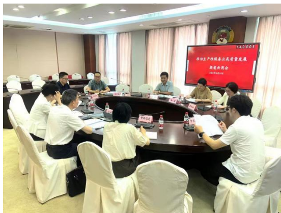
2025年为推动生产性服务业高质量发展建言献策