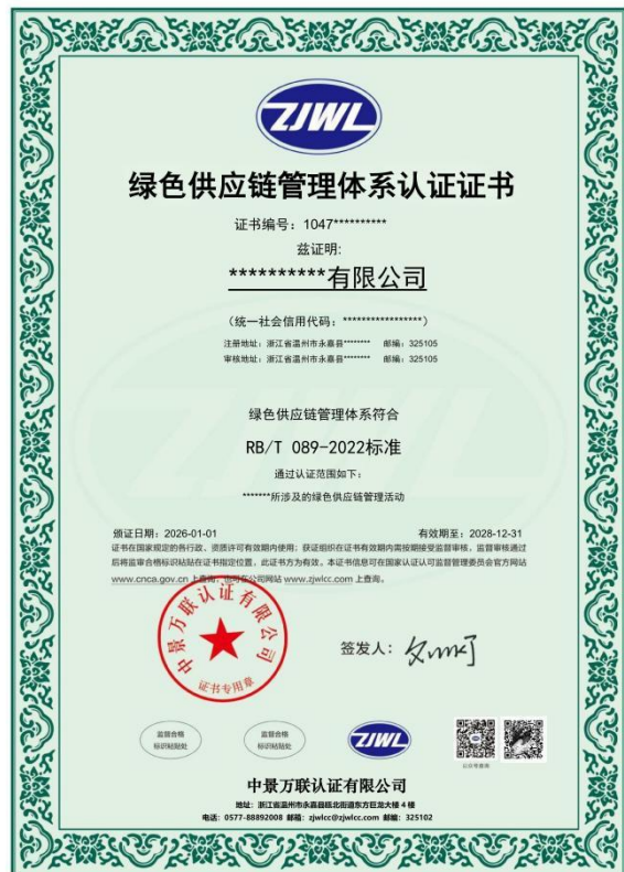
绿色供应链管理体系认证证书