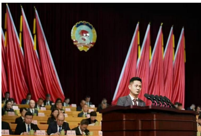
机构负责人参政议政