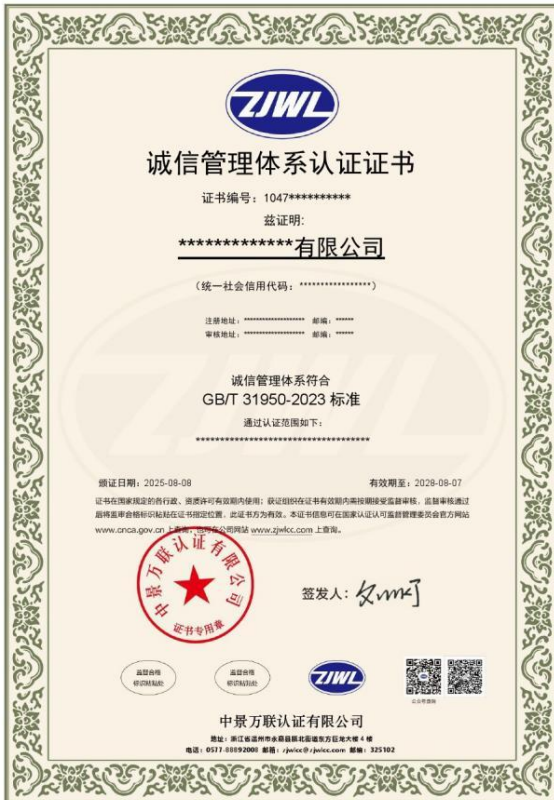
诚信管理体系认证证书