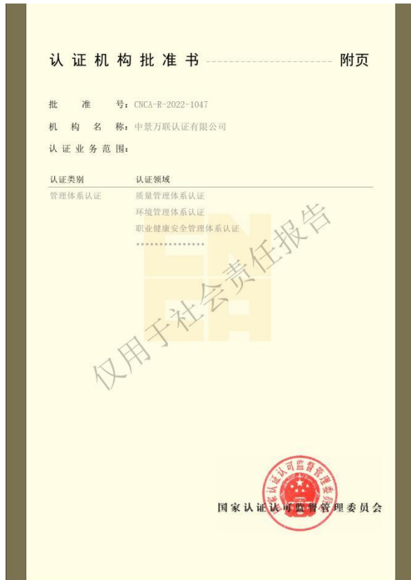
资质2：认证机构批准书（2025年）